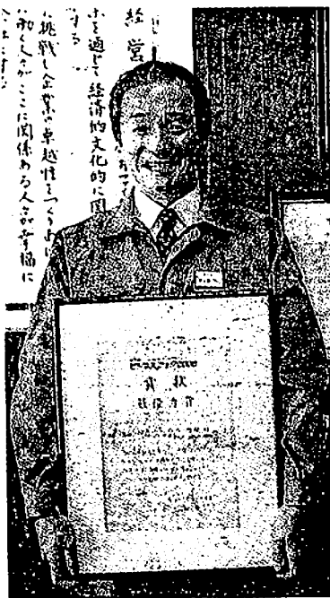
福井ファイバートック・福井社長

同賞は、東海4県39信用金庫の取引先の中で、産学官連携を手がけ、地域経済の活性化に貢献して